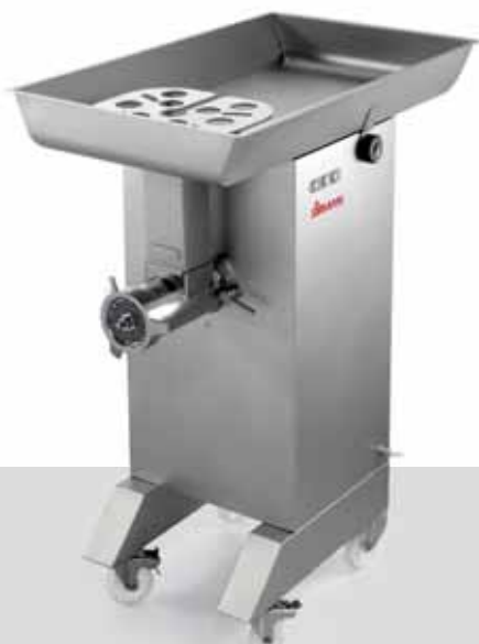
TC 32 MONTANA Y12