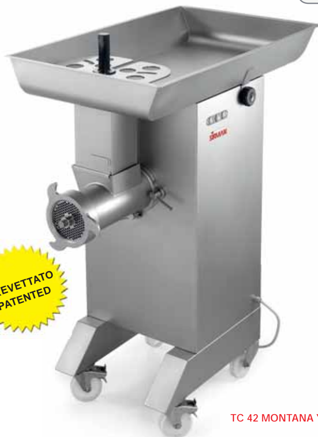
TC 42 MONTANA Y12