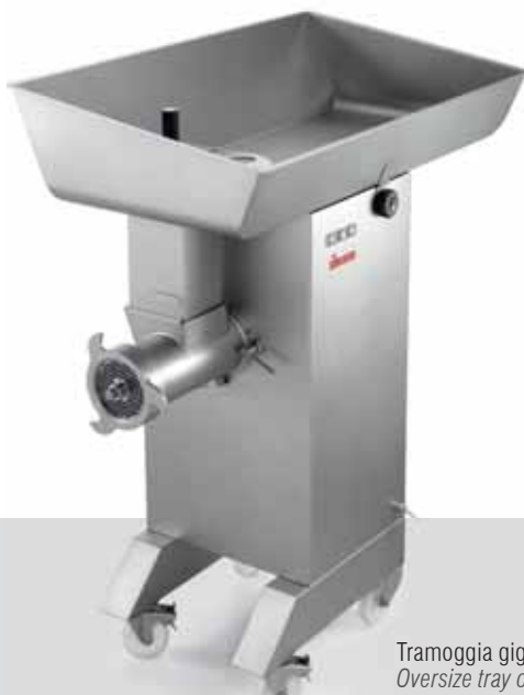
Tramoggia gigante opzionale Oversize tray optional